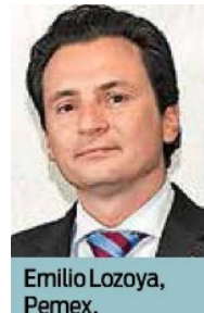
Emilio Lozoya, Pemex.

de Banxico, también fue integrado como consejero independiente.