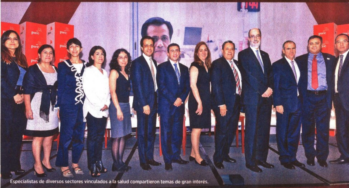
Especialistas de diversos sectores vinculados a la salud compartieron temas de gran interés.

Bajo el nombre de “En busca de un Sistema de Salud con Calidad: Evaluación de Equipos y Dispositivos Médicos”, el 10 de abril la práctica de salud de PwC México reunió a representantes de organizaciones e instituciones –públicas y privadas, nacionales y extranjeras- dedicadas a la prestación de servicios de salud, con el objetivo de plantear la importancia de la tecnología aplicada al sistema de salud universal.