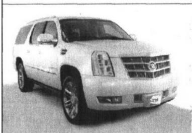
Cadillac Escalade 2009