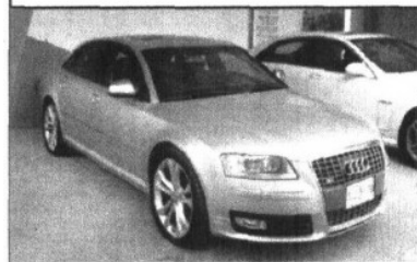
Audi S8 2009