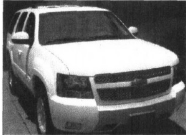
Chevrolet Tahoe 2013

De acuerdo con la AMBA, estos son algunos ejemplos de vehículos blindados y su precio a la venta