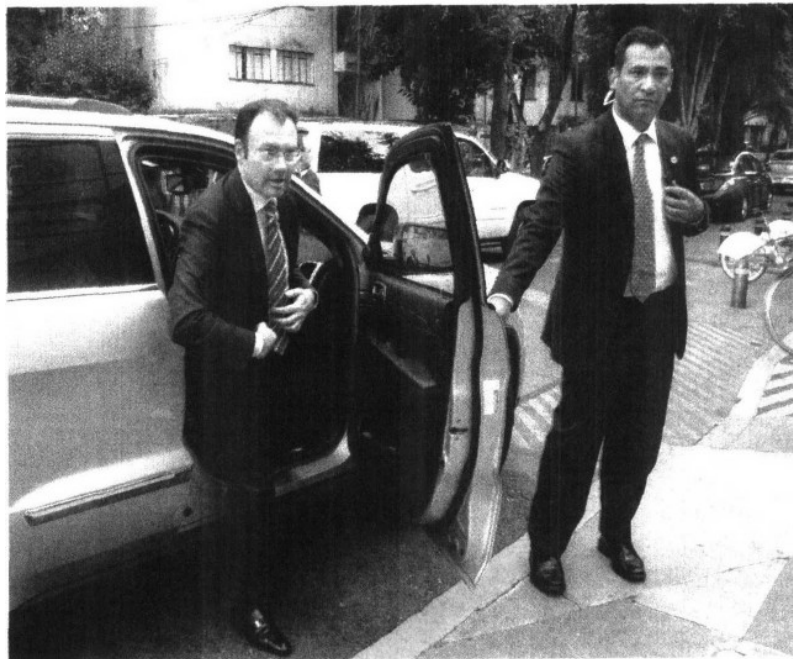
SEGURIDAD. Luis Videgaray Caso, secretario de Hacienda, y sus principales colaboradores utilizan vehículos con blindaje para su protección