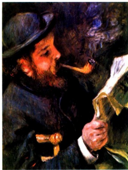
Claude Monet. Reading.

Alguien se atrevió a tocar la libertad de expresión que los mexicanos nos ganamos con sangre.