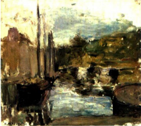
Henri Matisse. Brittany also known as boat.