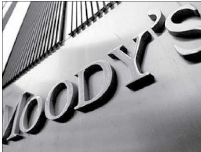
GRÁFICO EE: STAFF

Análisis. La firma presentó una nueva metodología para asignar calificaciones, la cual está en fase de aprobación.