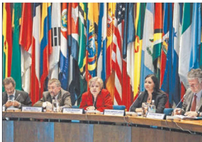
Alicia Bárcena (centro) , secretaria ejecutiva de la Cepal, ayer, en conferencia desde Santiago de Chile.