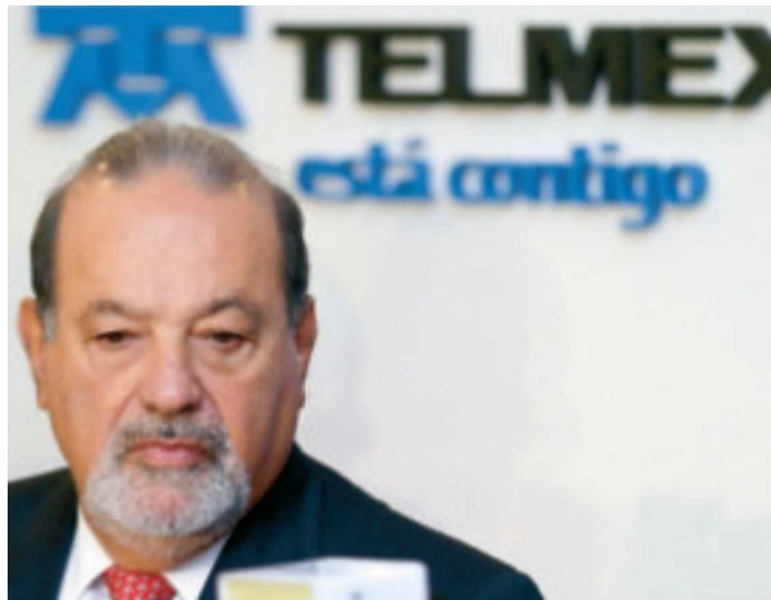
Carlos Slim presionó para que no se aprobaran en el periodo ordinario de sesiones las leyes secundarias en materia de telecomunicaciones.