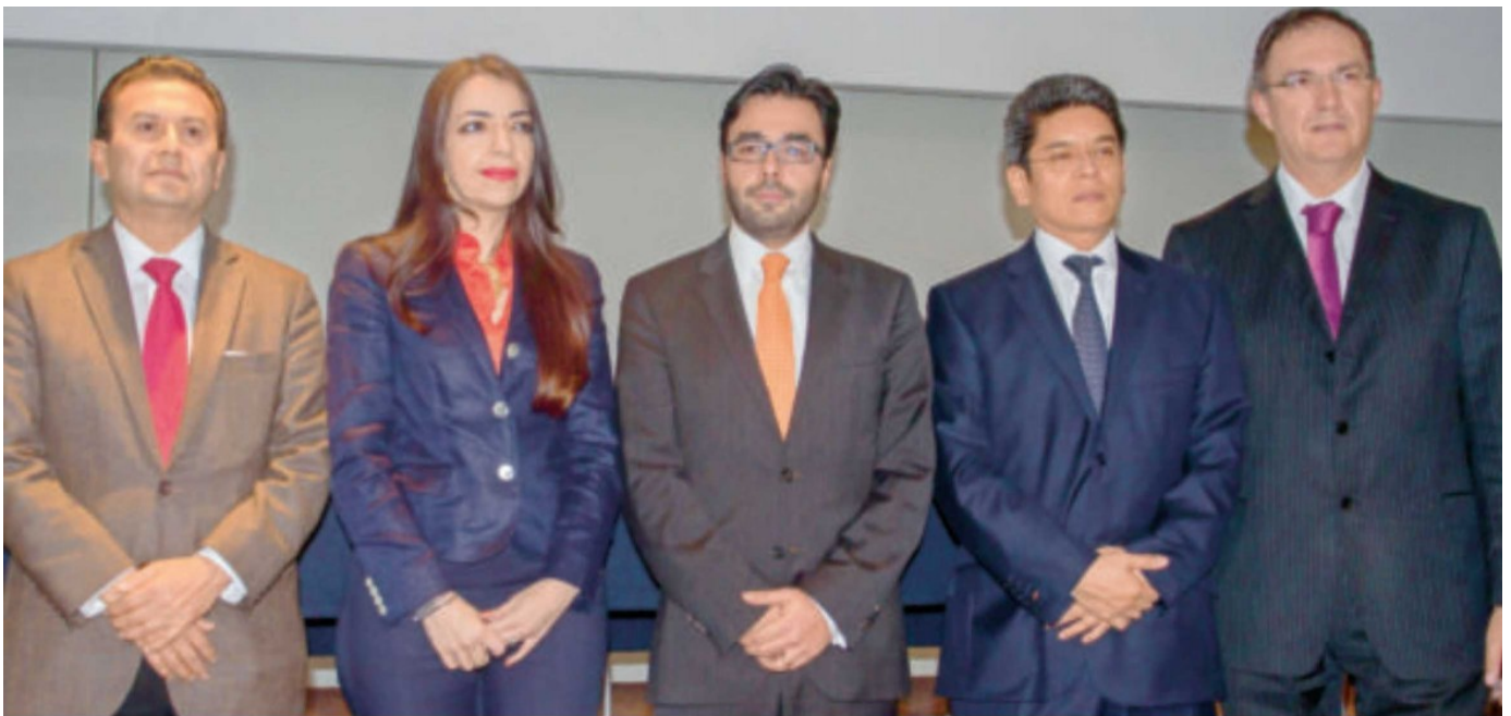
Los consejeros del Instituto Federal de Telecomunicaciones , encabezados por Gabriel Contreras, ofrecieron conferencia de prensa donde validaron la retransmisión de señales de televisión abierta de Televisa y TV Azteca a través de televisión por cable.