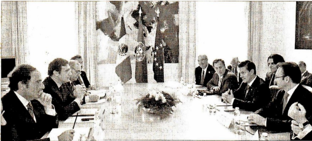
» LAS COMITIVAS de ambos países se reunieron para establecer nuevos acuerdos en la relación Méxi-co-Portugal.