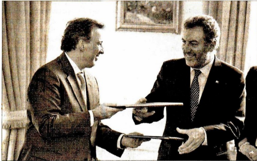
» EL CANCELLER José Antonio Meade, con su par lusitano.