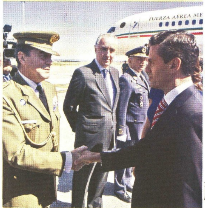
■ El Presidente Enrique Peña arribó ayer a España.