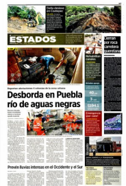
Una roca de 100 toneladas es retirada de un cerro ubicado a un costado de la carretera 200.