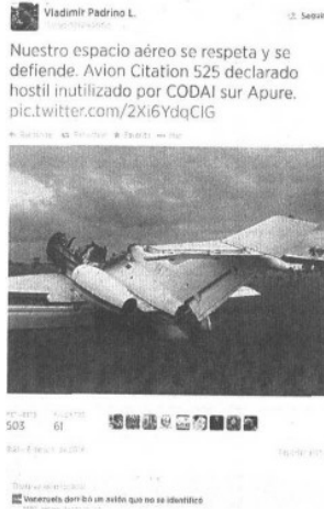
TUIT. El general Vladimir Padrino anuncia el derribe del aparato el viernes pasado

De acuerdo con lo publicado en un diario de Ve- nezuela, el bimo- tor estaba en poder de opera- dores del cártel de Sinaloa