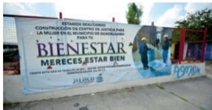
La construcción del Centro de Justicia para las Mujeres de Jalisco corre a cargo de la constructora Balken.