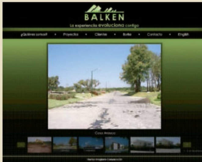
En el sitio de Internet de la empresa Balken se muestran las obras que ha realizado.