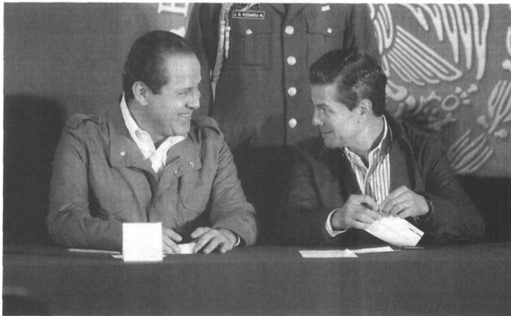
VISITA. El presidente Enrique Peña Nieto dijo al gobernador Eruviel Ávila que aún queda mucho camino por andar juntos, hasta 2017 en que concluye el periodo del mandatario mexiquense