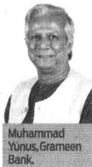
Muhammad Yunus, Grameen Bank.

Bajo la premisa de que cualquier persona de la base de la pirámide puede desarrollarse si se le da la oportunidad, el principal objetivo de este importante foro es detonar un movimiento que contribuya a erradicar la pobreza, cubriendo las deficiencias que hay en muchas