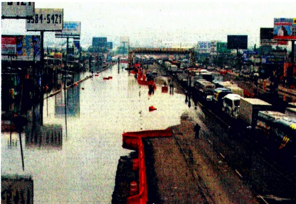
MANIFESTACIÓN. Cerca de 300 colonos de Ixtapaluca interrumpieron la circulación de la autopista México-Puebla, luego de que sus casas quedaron inundadas tras la tormenta del lunes

Más de 300 viviendas de las colonias Alfredo del Mazo y 20 de Noviembre tuvieron daños por la inundación