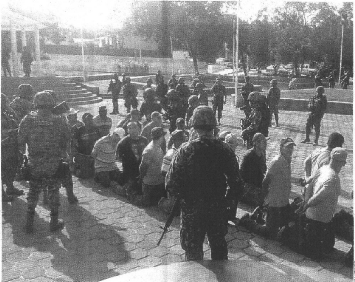
ACCIÓN. Militares y policía de Michoacán capturan a las personas armadas en la comunidad La Mira, en Lázaro Cárdenas

El líder nahua dijo que “es una traición, es una traición”.