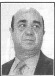
JESÚS MURILLO KARAM