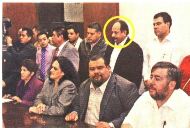
Alemán Vázquez pertenece al grupo cercano del ex presidente del PRI-DF, Cuauhtémoc Gutiérrez de la Torre.