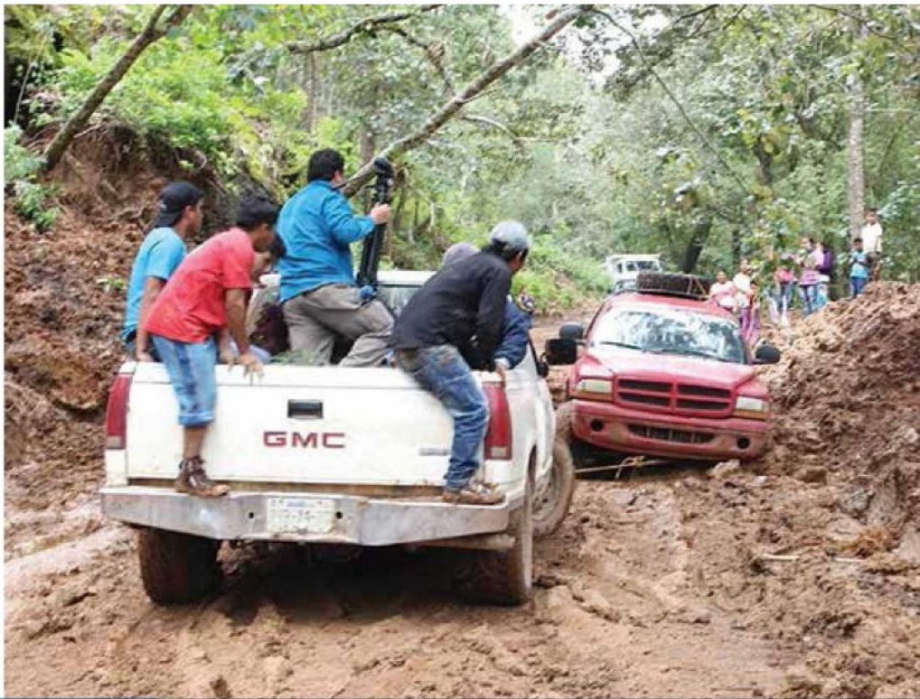
SÓLO POR HORAS Los poblados de San Vicente, El Fresno, Huacalapa, Ahuejitos y Coapango, en Chilpancingo, Guerrero, quedaron incomunicados por varias horas.