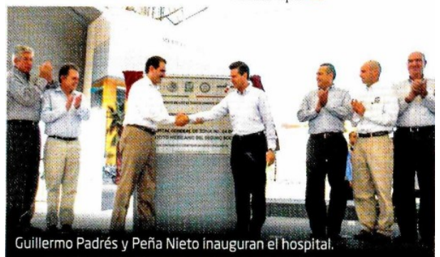
Guillermo Padrés y Peña Nieto inauguran el hospital.