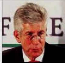
Aceleraremos para que den servicios bajo libre competencia GERARDO RUIZ ESPARZA, titular de la SCT