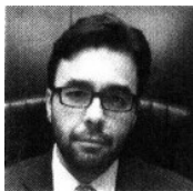
GABRIEL CONTRERAS, del IFT

El Instituto Federal de Telecomunicaciones (IFT), que preside Gabriel Contreras , ya comenzó su campaña informativa sobre el apagón analógico en el Distrito Federal a través de medios impresos. Aunque explica que sólo se necesita una televisión digital o un decodificador para recibir las señales, que son gratuitas, la página de internet no explica cuándo o cómo se llevará a cabo este proceso. No olvidemos que la falta de información llevó a que se tuvieran que "encender" las televisiones analógicas en Tijuana cuando se realizó el primer apagón en el país en mayo de 2013, y que el proceso pasó de ser responsabilidad del órgano regulador, a la Secretaría de Comunicaciones y Transportes. Además, sobre la marcha se modificó el parámetro de medición de penetración del 90% de hogares de una ciudad, al 90% de los beneficiarios de un padrón de Sedesol, que esta misma dependencia asegura que hasta ahora no existe.