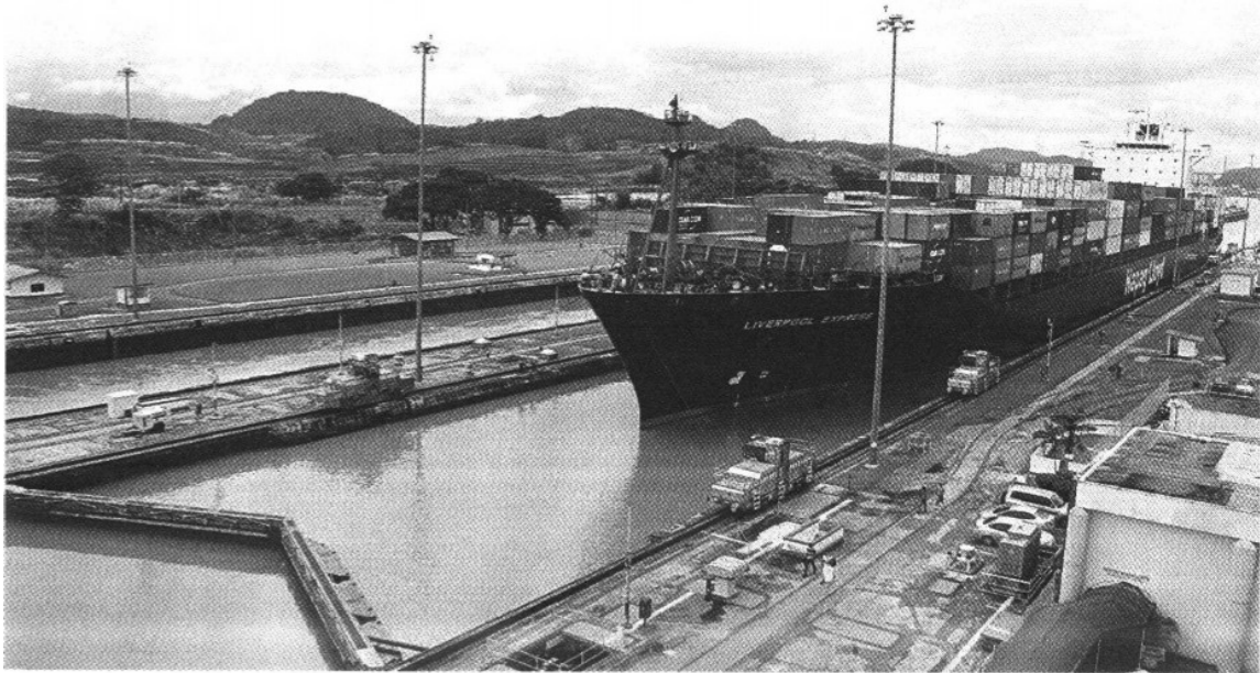
MOVIMIENTO. La capacidad aumentará 64% y el número de tránsitos se incrementará 29% con la ampliación del Canal.