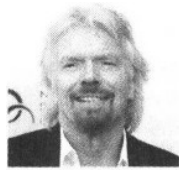
RICHARD BRANSON , CEO de Virgin

De CEO a CEO. Carlos Slim Helú, dueño de Grupo Carso, no está solo en cuanto a sus ideas, pues Richard Branson , CEO de Virgin, apoya su propuesta de laborar tres días a la semana. Hace algunos días, el empresario mexicano volvió a proponer semanas laborales de tres días pues, argumentando que la gente es más productiva, y Branson apoya ese planteamiento. El dueño del conglomerado Virgin, que está presente en el país a través de Virgin Mobile México- aseguró en su blog que la semana laboral de lunes a viernes resulta cada vez más ineficiente.