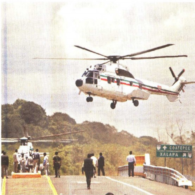
COPILOTO DE LUJO. El Presidente Enrique Peña Nieto se hizo acompañar del piloto de la Fórmula Uno Sergio "Checo" Pérez durante su recorrido por el recién inaugurado Libramiento de Coatepec en Veracruz.