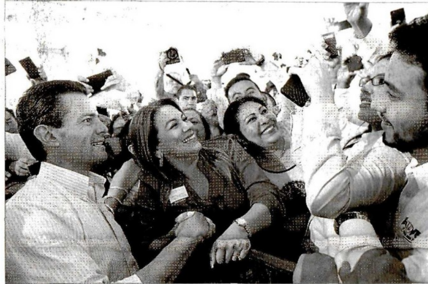
» EL PRESIDENTE Enrique Peña Nieto fue recibido por los veracruzanos entre el júbilo y las fotografías.

el apoyo brindado porque “nuestros proyectos se están haciendo realidad; especialmente para todos aquellos que anhelamos el progreso de nuestros pueblos, habitados por gente trabajadora y talentosa, como son nuestros productores de café y caña de azúcar; obreros, campesinos, docentes y estudiantes”.