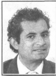
ENRIQUE OCHOA REZA

la Comisión Federal de Electricidad, que dirige Enrique Ochoa Reza , cedió al gobierno del Estado de México las instalaciones del Hotel Colorines en Valle de Bravo para que se convierta en una Base de Operaciones de Avanzada de Infantería, de la Secretaría de Marina, como parte de la estrategia de seguridad de la entidad mexicana, que encabeza Eruviel Ávila . El contrato, nos explican,