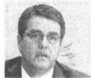
ROBERTO AZEVEDO, de la OMC

Atorón. Al sector empresarial le preocupa el impasse que se vive nuevamente en la Organización Mundial del Comercio (OMC), que dirige el brasileño Roberto Azevedo . La Cámara de Comercio Internacional es de las más activas en externar su inquietud, así que en cualquier foro y a través de comunicados de prensa ha dejado en claro que si