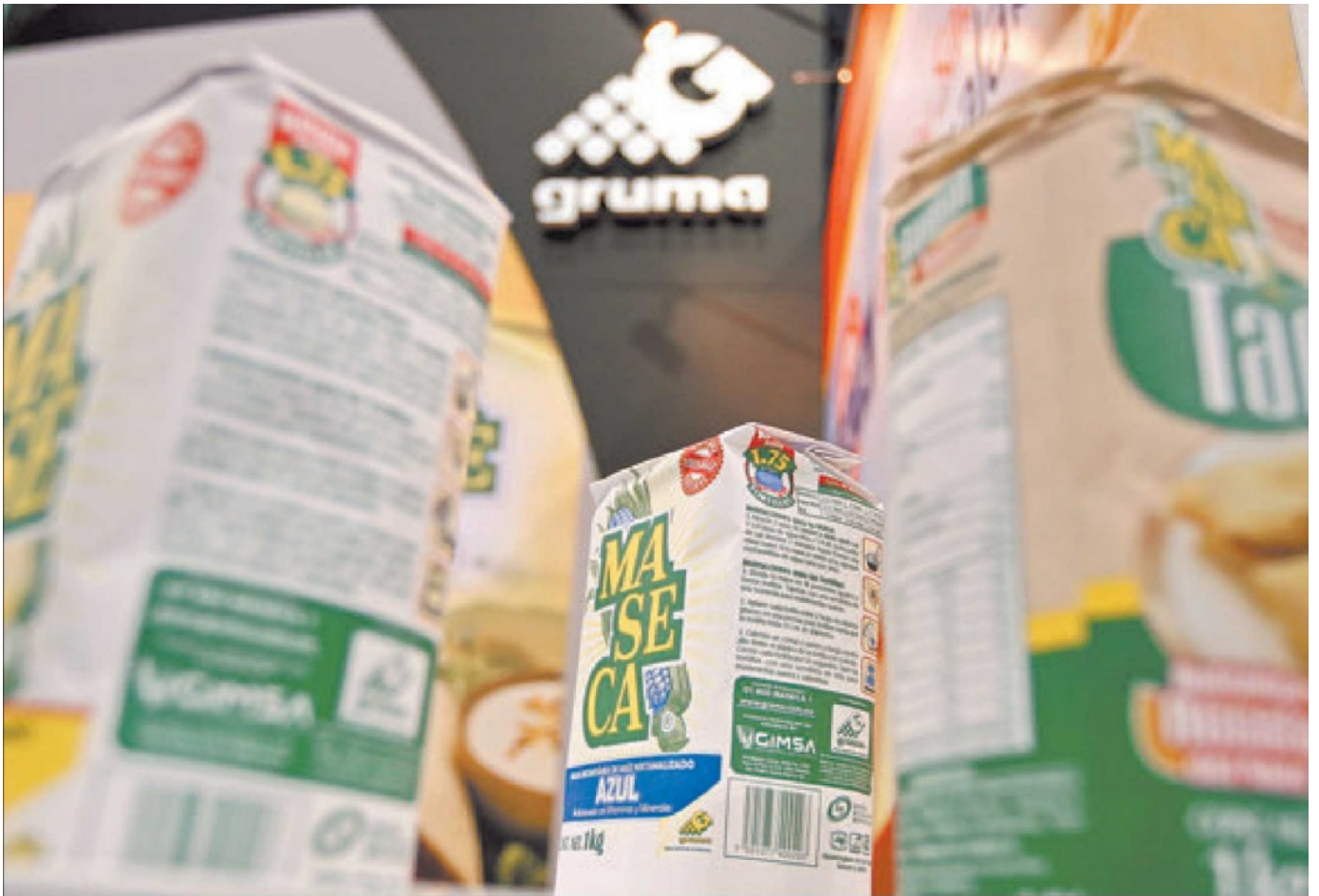
La clave del éxito de la fabricante de productos de harina de trigo y maíz es que ha sabido diversificarse en los mercados donde participa.