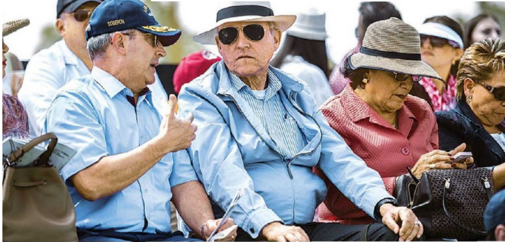
Los titulares de las secretarías de Marina-Armada de México, Vidal Francisco Soberón Sanz, y de la Defensa Nacional (Sedena), Salvador Vega Casillas, presenciaron la exhibición aérea.