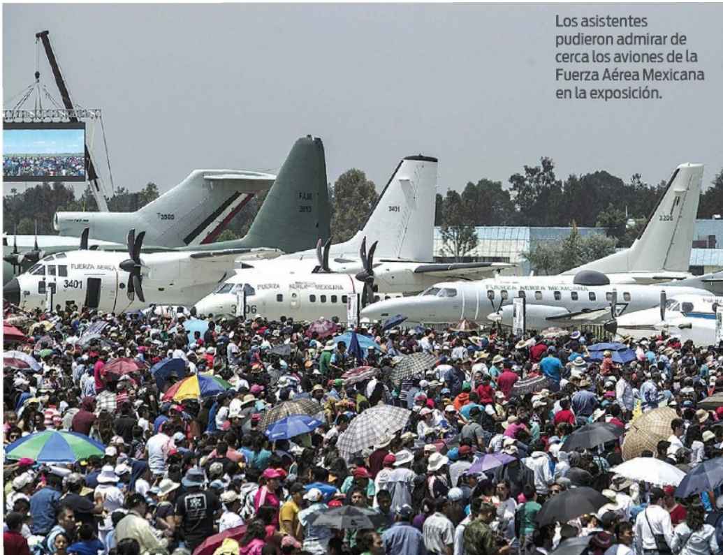
Los asistentes pudieron admirar de cerca los aviones de la Fuerza Aérea Mexicana en la exposición.