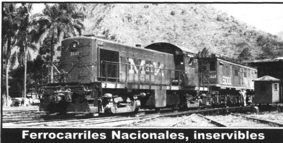
Ferrocarriles Nacionales, inservibles

Expuso que esta organización sigue cobrando cuotas a los 35 mil ex trabajadores y demandó una auditoría a los dos fondos millonarios en la gestión de Flores y el esclarecimiento del uso de los recursos.