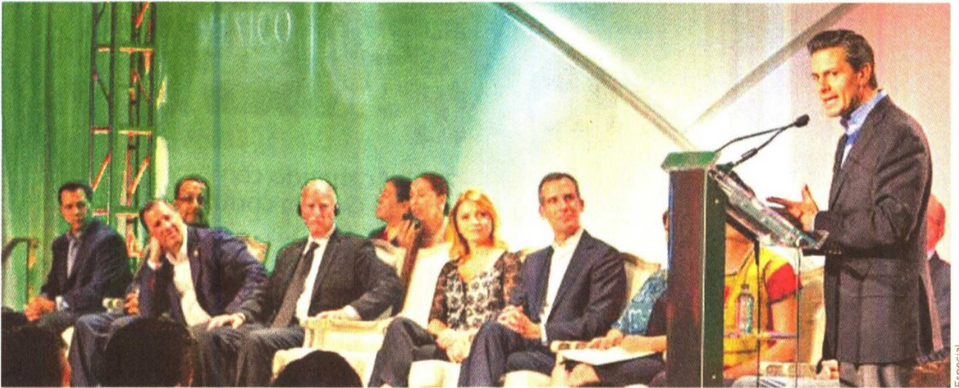
COMO EN CASA. El Presidente Enrique Peña encabezó la reunión con líderes comunitarios y mexicanos destacados en Los Ángeles, al cual asistió el Alcalde local, Eric Garcetti, y el Gobernador de California, Jerry Brown.