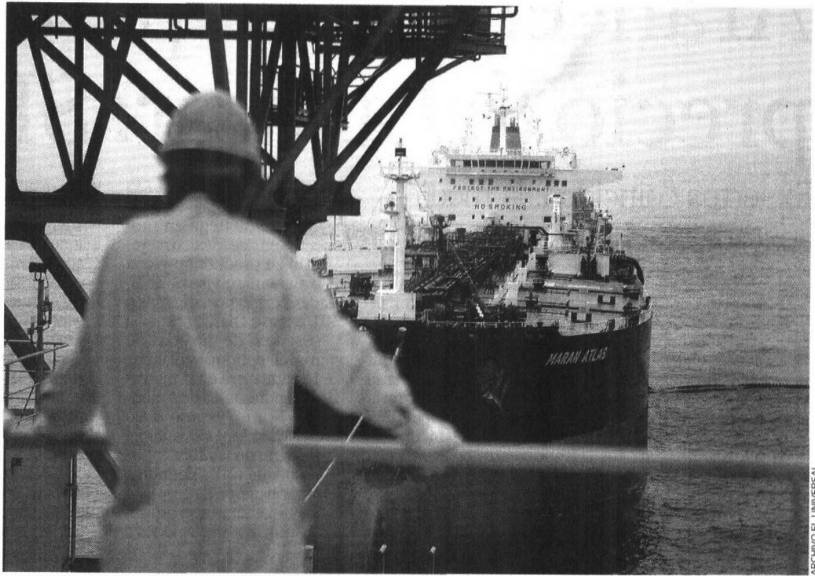
CAÍDA. Un trabajador en la plataforma Ku Maloob Zaap. La exportación de petróleo se redujo en comparación anual