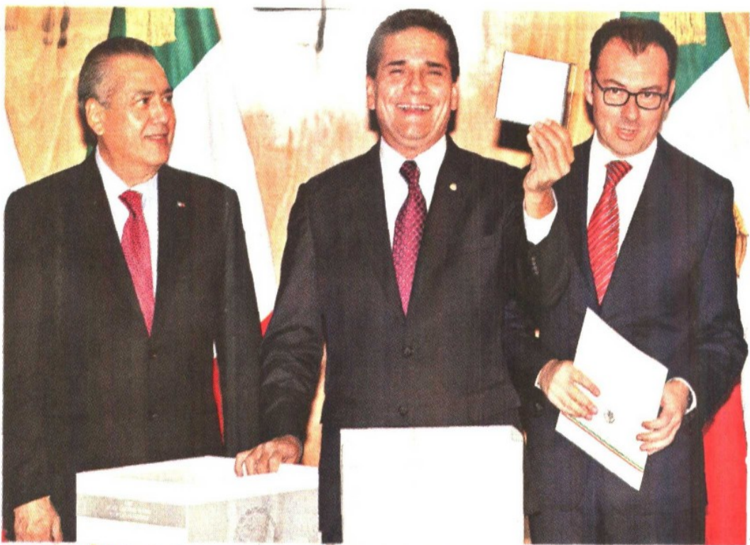
RECEPCIÓN. Manlio Fabio Beltrones, presidente de la Junta de Coordinación Política de la Cámara baja; Silvano Aureoles, presidente de la Mesa Directiva, y Luis Videgaray, titular de Hacienda.

FUENTE: SHCP. Exposición de Motivos. Proyecto de Presupuesto de Egresos 2015.