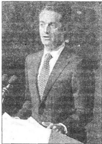
Carlos Slim Domit, presidente de Grupo Carso, al participar en el foro México Siglo XXI, en el Auditorio Nacional

En el arte, se refirió al museo Soumaya, mientras que en el deporte la Copa Telmex , la liga Telmex de béisbol, la escudería de automovilismo Telmex , que llegó a 300 triunfos. Los 31 pilotos también han visitado 155 escuelas privadas y públicas para promocionar la cultura de la prevención de accidentes, entre otros logros.