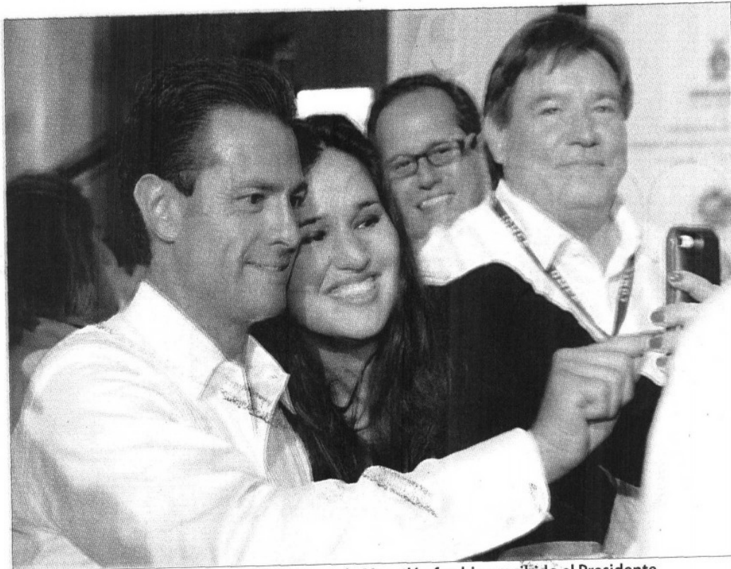
» EN EL Centro de Convenciones de Mazatlán fue bien recibido el Presidente.