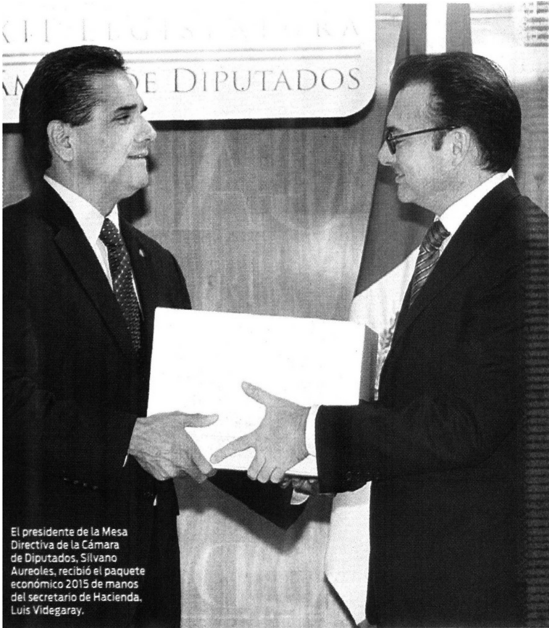
El presidente de la Mesa Directiva de la Cámara de Diputados, Silvano Aureoles, recibió el paquete económico 2015 de manos del secretario de Hacienda, Luis Videgaray.