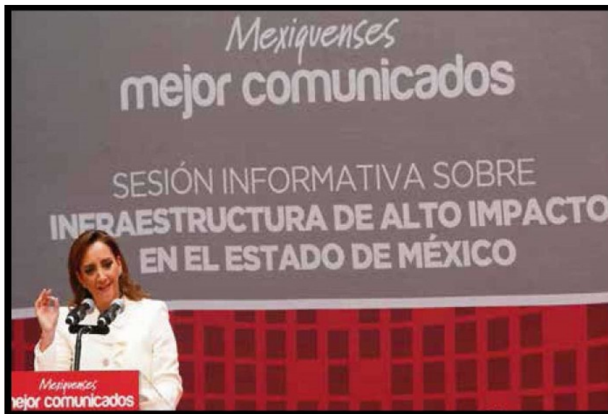
Claudia Ruiz Massieu.