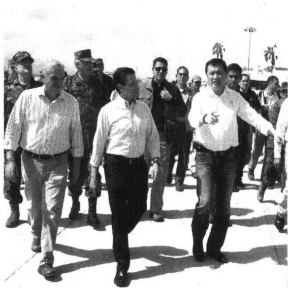
ISAIAS PÉREZ | EL UNIVERSAL