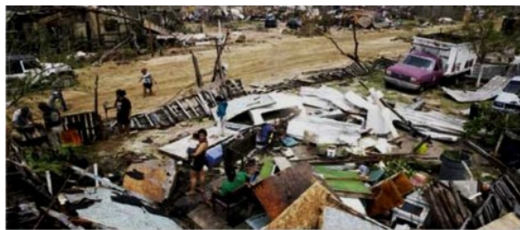
HABITANTES DE un barrio irregular de Los Cabos, ayer, buscan sus pertenencias entre los escombros de sus casas.