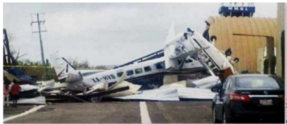
UNA AVIONETA tipo Cessna fue destruida el lunes mientras estaba en tierra, en el aeropuerto de Cabo San Lucas.

El fenómeno alcanzó la categoría 3, dejando importantes daños en la entidad sudcaliforniana.