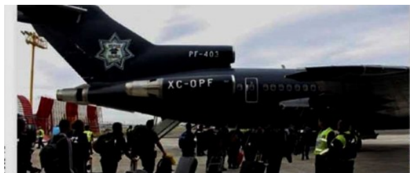
PERSONAL de la Policía Federal partió ayer del DF para sumarse a las labores de apoyo a la población en BCS.