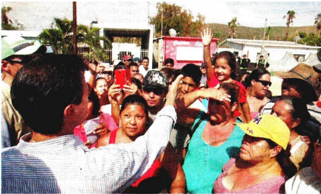
El Presidente Enrique Peña Nieto indicó que uno de los frentes que atiende su gobierno es el de restituir y restablecer los servicios más sensibles y más importantes que se han colapsado, particularmente energía eléctrica y agua potable. En tanto, refrendó, continuará la entrega de víveres, despensas y de agua a las familias afectadas.