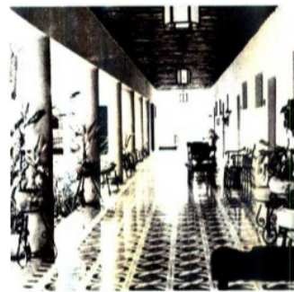
1969. El hotel Hacienda Uxmal fue inaugurado con 50 cuartos y 100 empleados.

Carmen y Mérida, obras que hicieron de la región lo que es hoy.