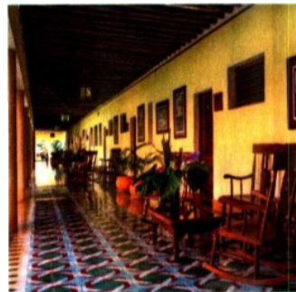
2014. Hoy, el hotel remodeló y mantuvo la arquitectura tradicional de las haciendas henequeneras.