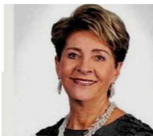
Mercedes Juan López