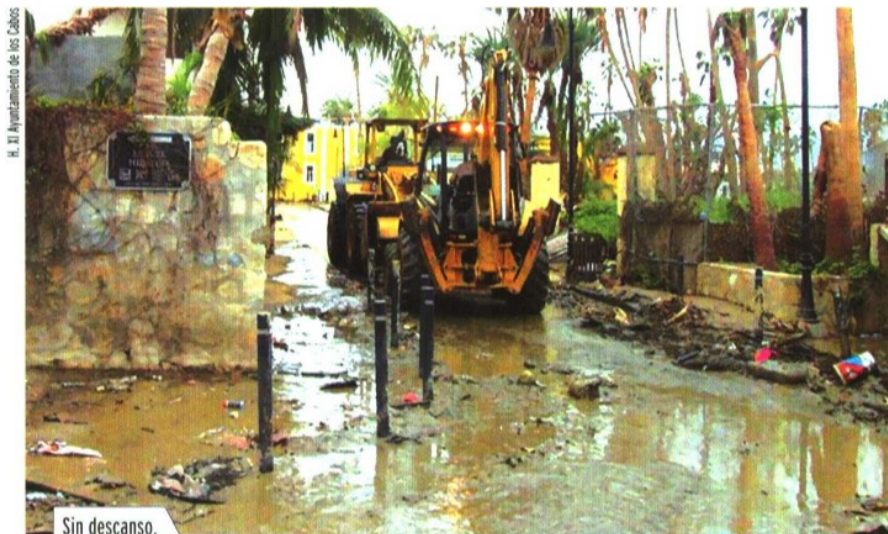
H. II Ayuntamiento de los Cabos