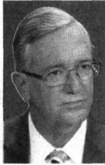
RICARDO SALINAS PLIEGO