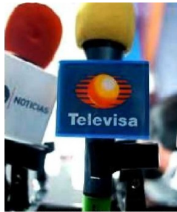
Grupo Televisa lanza Izzi.