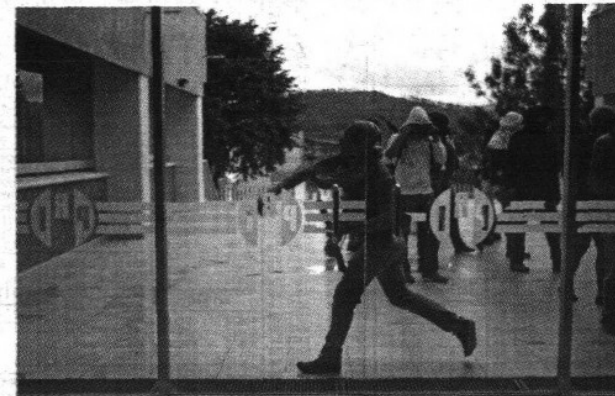
Por segundo día consecutivo, estudiantes normalistas realizaron destrozos en sedes de partidos políticos en Michoacán