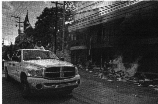
En Oaxaca hubo movilizaciones y acciones de protesta en diferentes puntos de la entidad