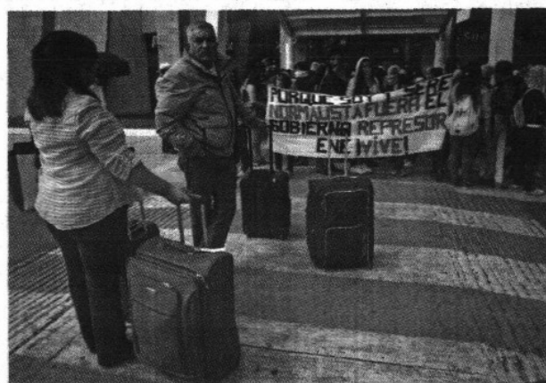
Hoteleros de Acapulco piden tregua a normalistas