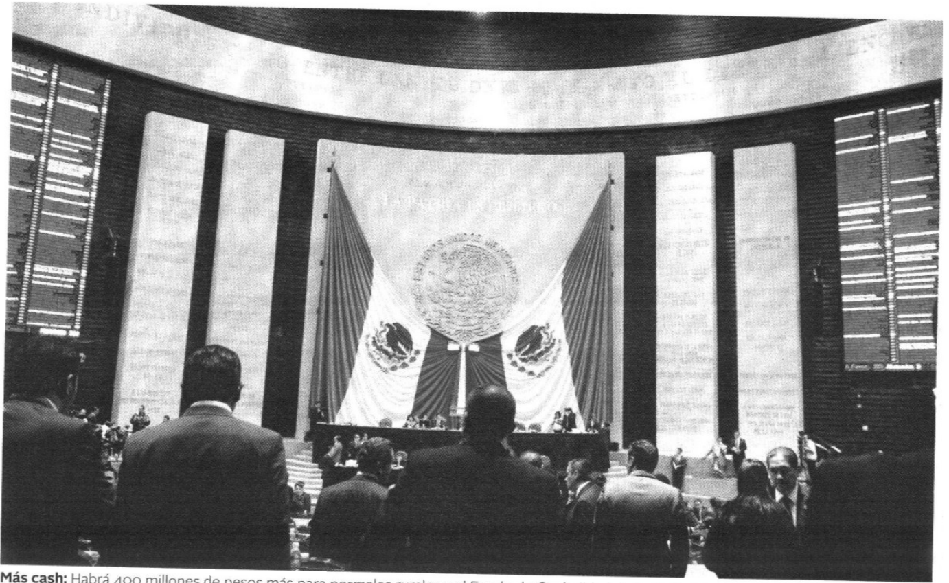
Más cash: Habrá 400 millones de pesos más para normales rurales y al Fondo de Capitalidad de la Ciudad de México, mil 500 millones extra.